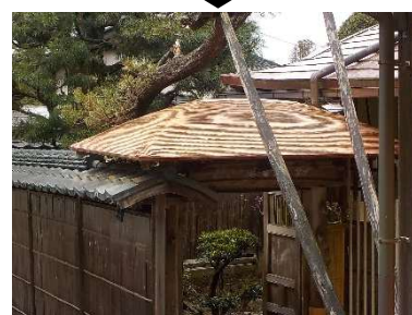
和合庵修繕前と修繕後