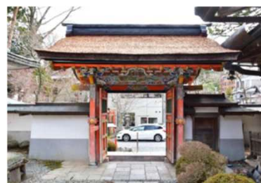
普賢院四脚門 屋根葺き替え完了状況