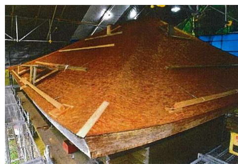
金剛三昧院経蔵屋根葺き替え状況

文化財保存計画策定事業に係る建造物の調査を行い、風致を構成する建造物等の特徴を明らかできたことで、より適切な保護体制がとれるようになった。