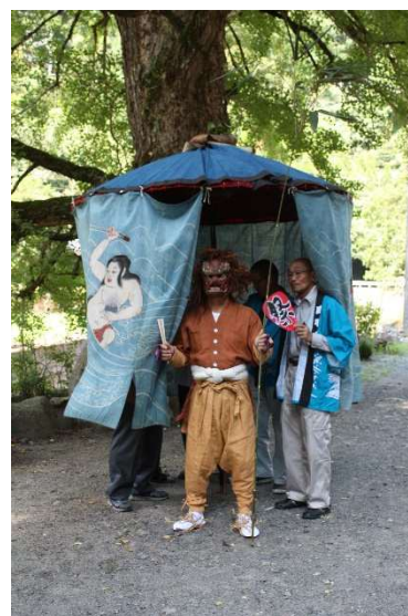
細川傘鉾祭りの様子