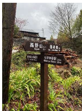
参詣道多言語看板 R5

また、総本山金剛峯寺周辺の木柵等の改修を行うため、街並み景観の統一感が外国人観光客及び国内観光客の満足度向上へと繋がった。