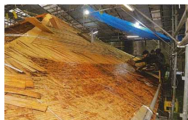
奥院経蔵屋根葺き替え状況

文化財保存計画策定事業や大名墓総合調査事業により、風致を構成する建造物等の特徴を明らかにできたことで、より適切な保護体制がとれるようになった。