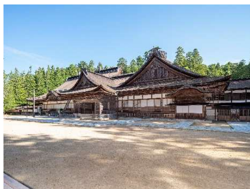
金剛峯寺本坊 大主殿及び奥書院 外観

文化財保存計画策定事業に係る建造物の調査を行い、風致を構成する建造物等の特徴を明らかにできたことで、より適切な保護体制がとれるようになった。その成果に基づき、金剛峯寺本坊12棟が国重要文化財に指定され、より適切に文化財保護を行えるようになった。