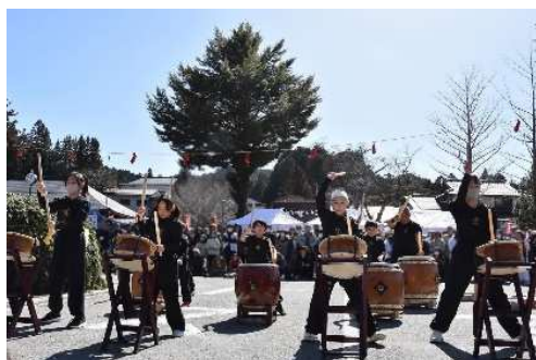
民俗芸能(太鼓)活動状況

民俗芸能団体の活動費の補助を行うことで、民俗芸能団体への支援を行っている。 高野山の歴史や文化についての理解を深める機会として、高野山を総合的に学ぶ講座「高野山学」を開講し、5年間でのべ5,624人が受講した。