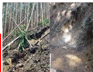
参詣道修理(修理前・修理後)