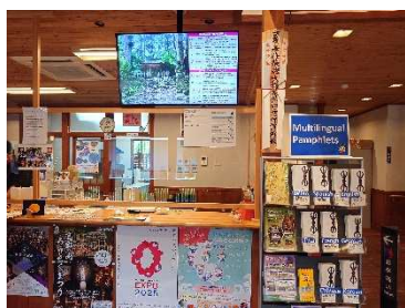
多言語パンフレット・サイネージ