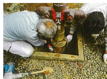
大門消火栓修繕状況

文化財保存計画策定事業等により多くの文化財の存在や特徴を把握できたことでより適正な保護を行えるようになった。