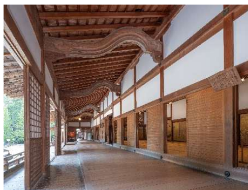
金剛峯寺本坊 大主殿及び奥書院 表回廊