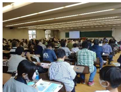
高野山学 講義開催状況