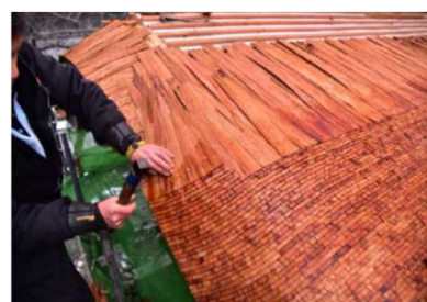
普賢院四脚門屋根葺き替え状況