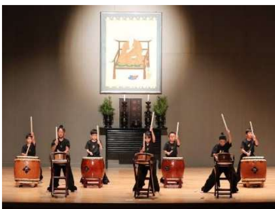
民俗芸能団体活動状況

郷土民俗芸能支援事業で地域の祭礼に係る団体の活動に補助金を支給することで風致の維持を図った。