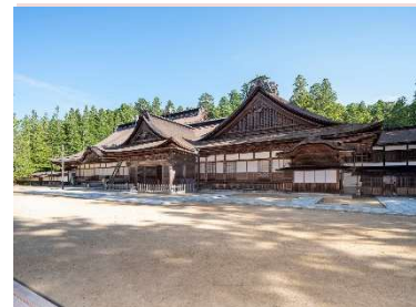
重要文化財 金剛峯寺本坊

ふるさと学習副読本の改訂によって、学校教育におけるふるさと学習がより効果的に行えるようになり、地域の文化財学習によって地域への理解が進み、より郷土愛が醸成された。